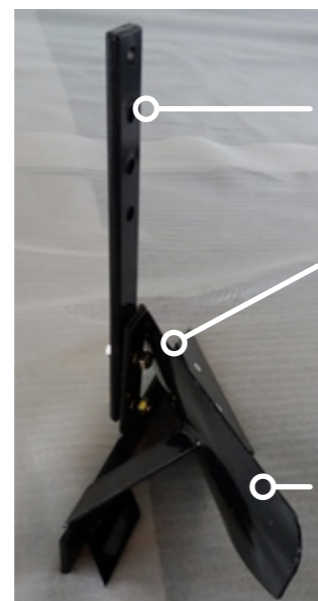
Barra de enganche

Cuarto paso: realice el montaje previo del arado unilateral