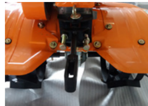
Retire la barra de control de velocidad.