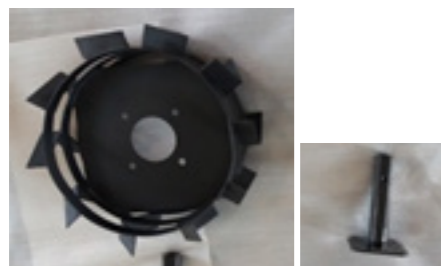
Rueda Metálica | Eje de las Ruedas Metálicas

Segundo paso: Realice el montaje previo de las ruedas metálicas (Ruedas de Hierro)